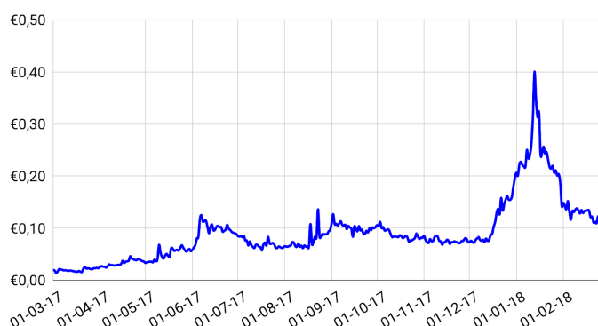
Jaargrafiek Guldenkoers in Euro